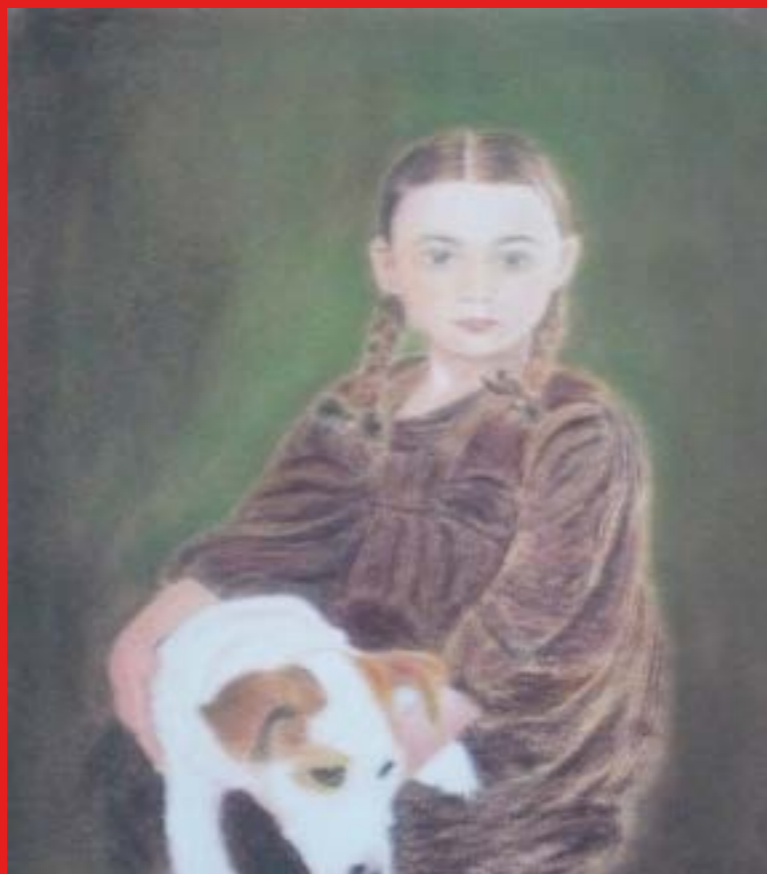
Marcel CHARLIER, Niña con perro