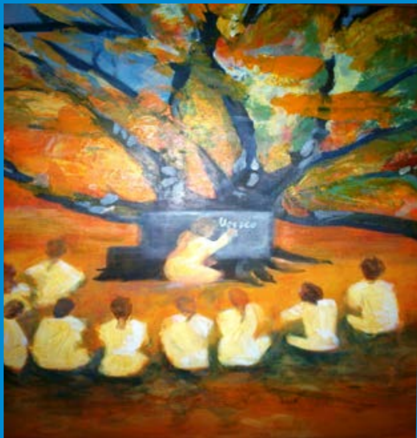
Patricia MORALES, Un árbol y los estudiantes