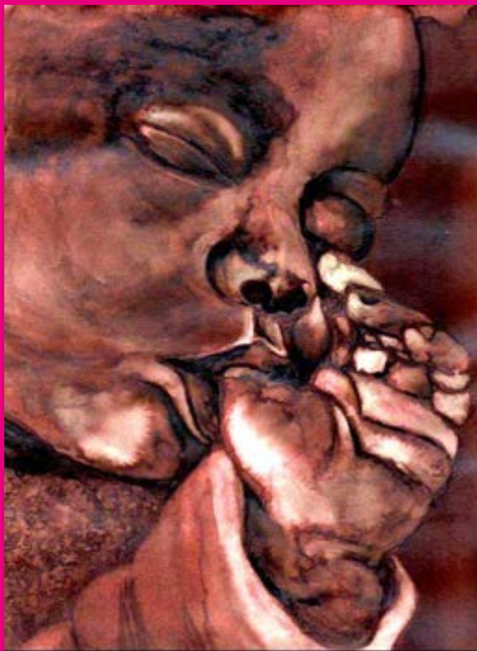
Greta PINTELON, Los primeros pasos