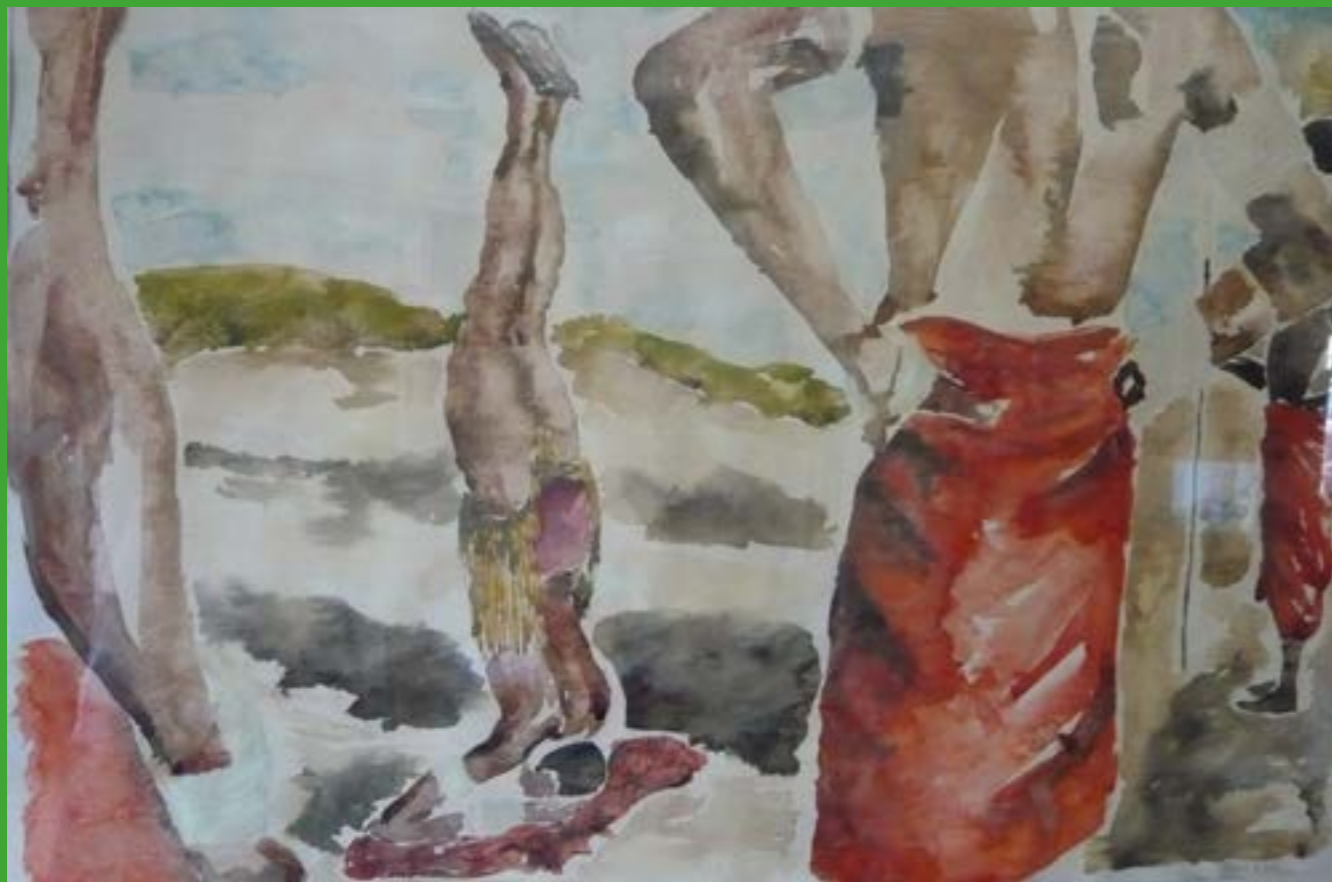
Rita STADLER, Los jóvenes cazadores 1