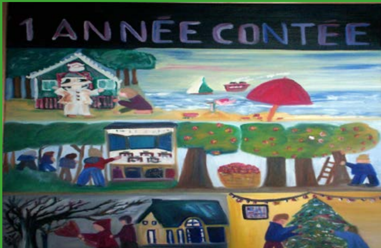
Jeannine NIEZETTE, Un año se cuenta en los meses 1