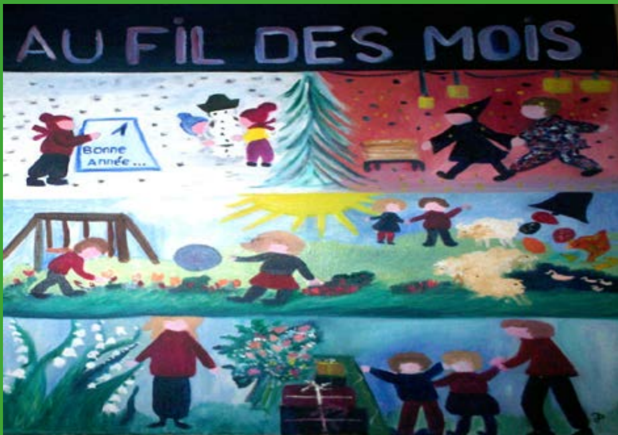
Jeannine NIEZETTE, Un año se cuenta en los meses 2