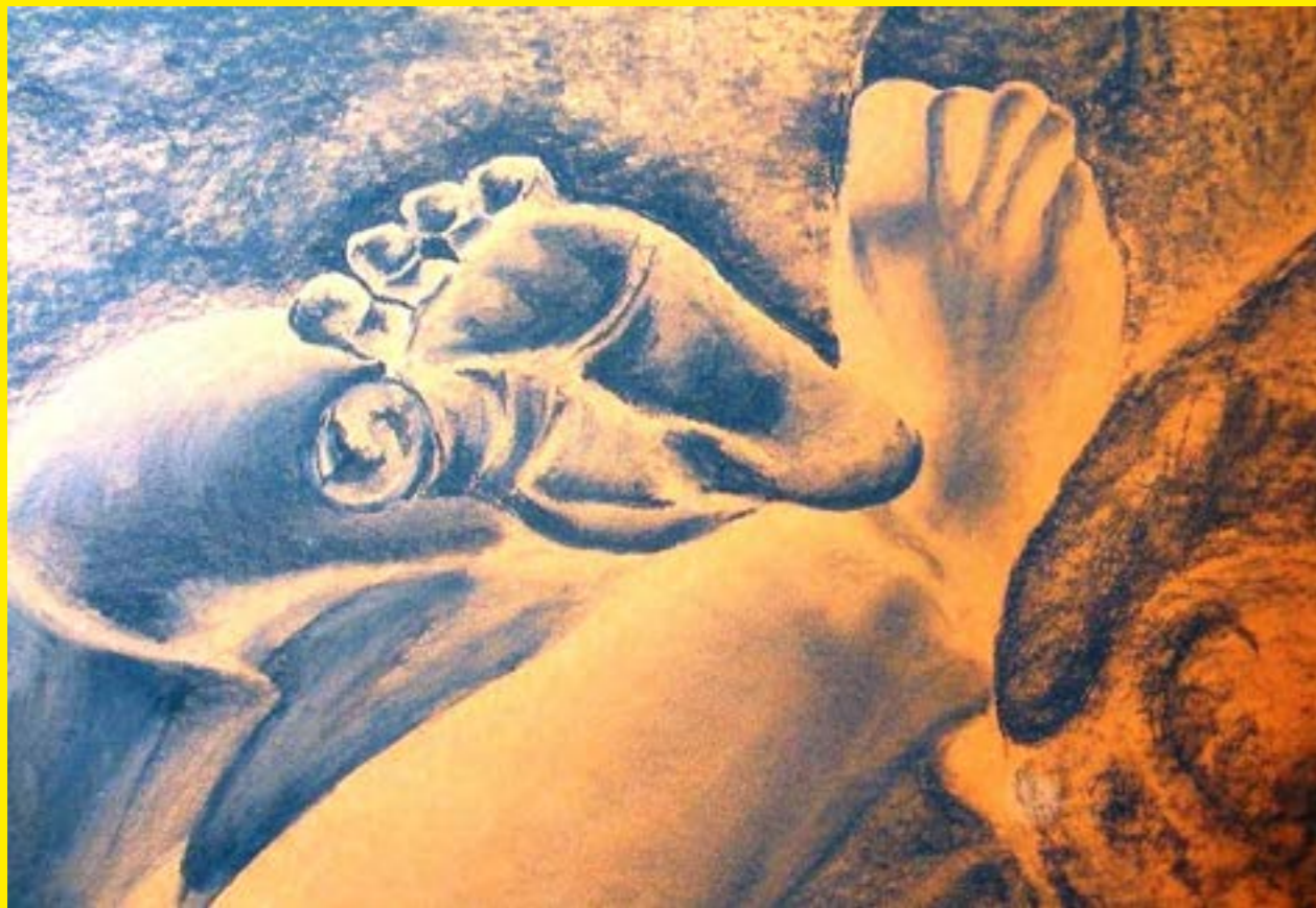
Greta PINTELON, Los primeros pasos